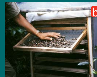
Figura 4. a). Jaula de exclusión; b). Zaranda con café infestado.